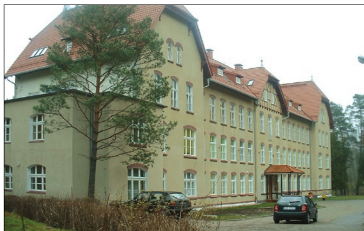
Wojewódzki Szpital Rehabilitacyjny dla Dzieci w Ameryce

Dziękuję Panu za udzielenie wywiadu, uzyskane wyróżnienie jest miłym akcentem naszej pracy.