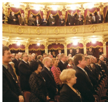
Widok na salę w teatrze J. Słowackiego