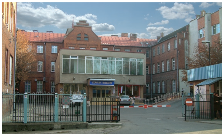
Szpital Miejski w Olsztynie

W. L. – Istnieje naturalna konkurencja między olsztyńskimi oddziałami czy szpitalami, jakie atuty ma Szpital Miejski?