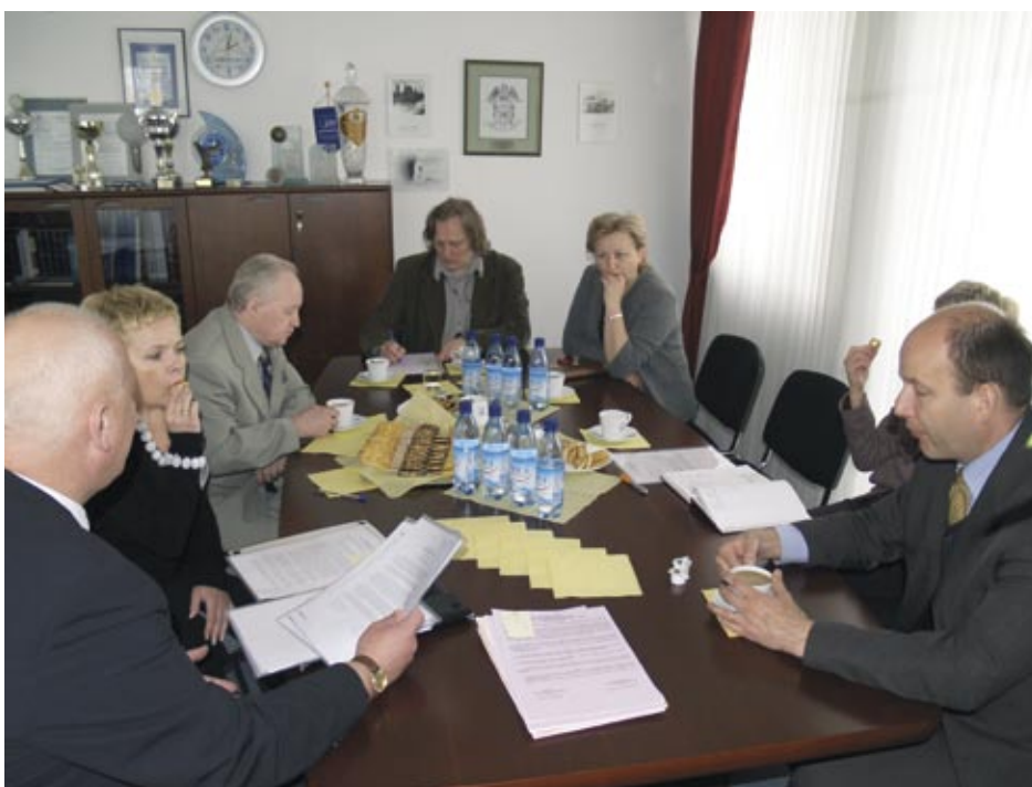
Posiedzenie prezydium ORL