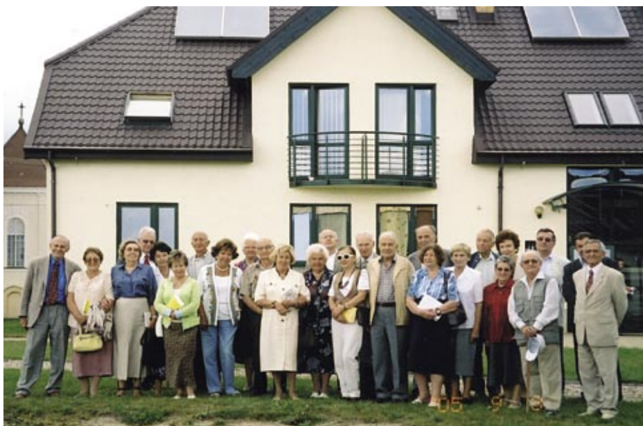
Turośl Kościelna k. Białegostoku. Dom Lekarza Seniora Białostockiej Izby Lekarskiej

Spotkanie odbędzie się w Auli im. M.G. Dietrichów w Centrum Nauk Humanistycznych Uniwersytetu Warmińsko-Mazurskiego w Olsztynie przy ul. Kurta Obitza 1 (budynek obok Centrum Konferencyjnego)