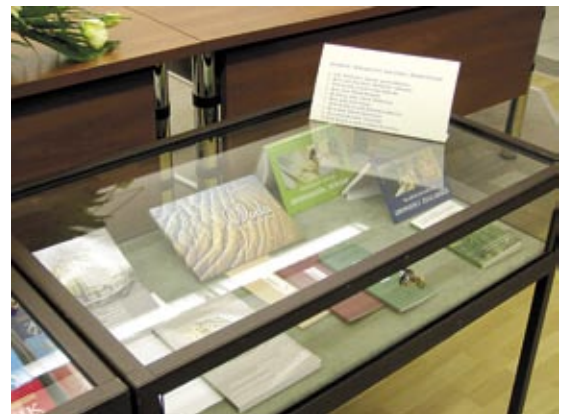
Wystawa prac artystów

Niezwykle interesujące i owocne było spotkanie z poetą i jednocześnie kustoszem Muzeum K. I. Gałczyńskiego w leśniczówce Pranie, który oprócz opowieści o autorze poematu „Kronika Olsztyńska” mówił również o Ignacym Krasickim a także o innych twórcach, przyjacielałach i znajomych K. I. Gałczyńskiego oraz o tych, którzy tworzyli na ziemi mazurskiej. Następnie poeta prowadził