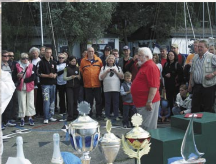
Ceremonia wręczenia nagród