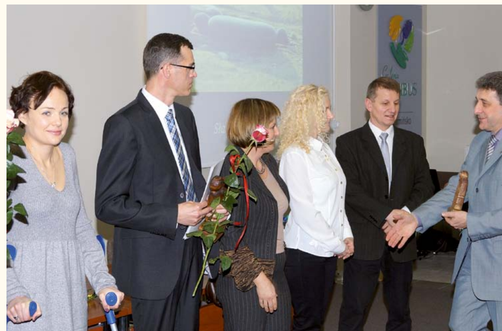
Laureaci Konkursu Fotograficznego „Kamień i Woda”