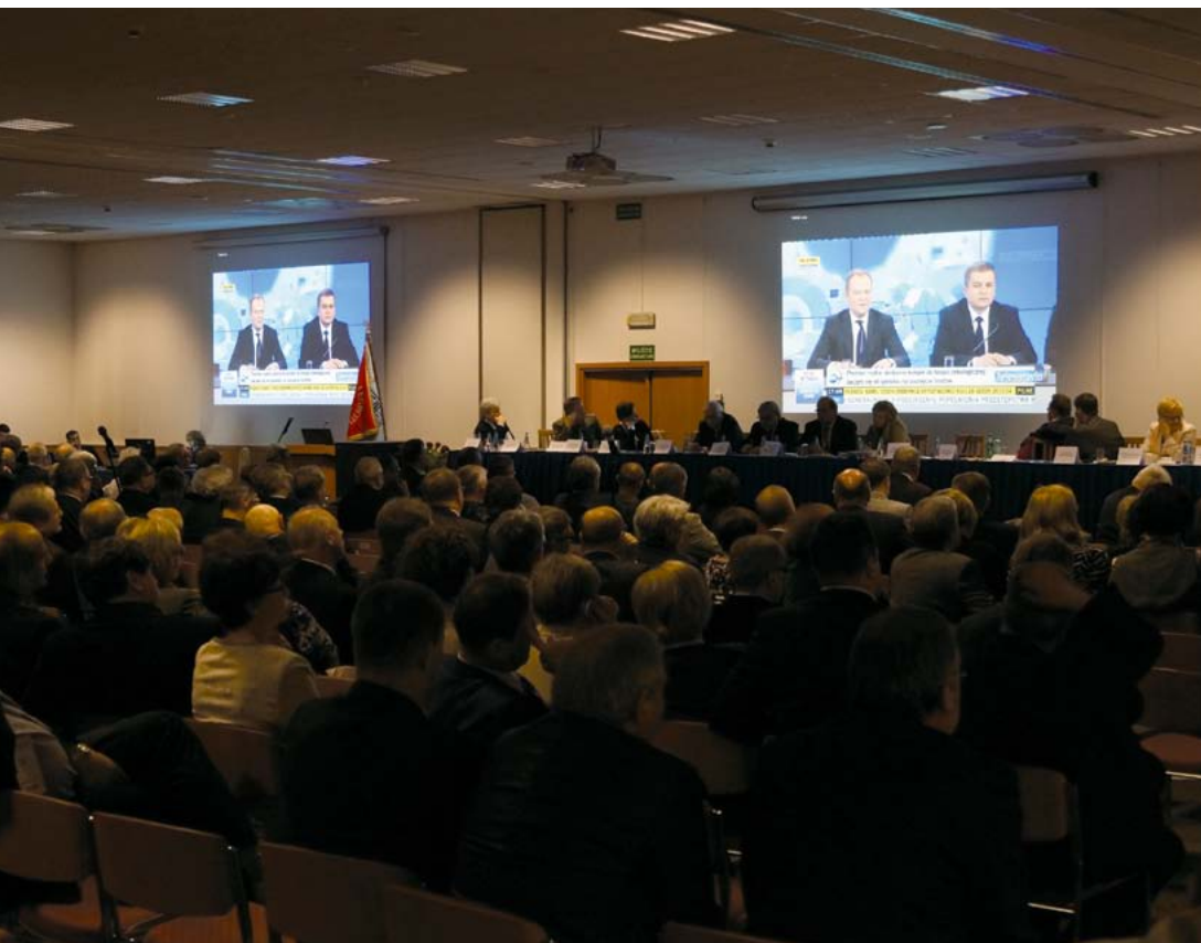
Delegaci w trakcie transmisji wystąpienia Ministra Zdrowia dotyczącego pakietu antykolejkowego