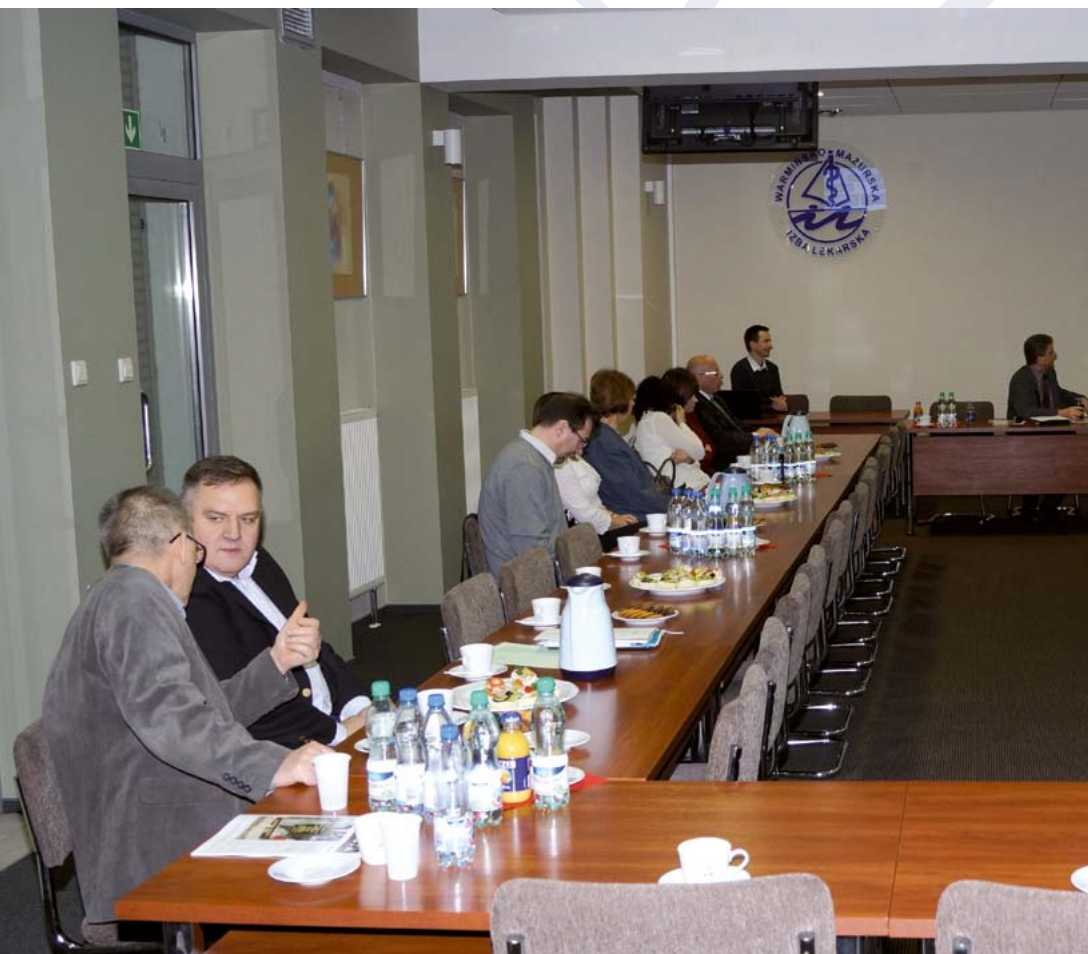
Posiedzenie Okręgowej Rady Lekarskiej 19 marca 2014