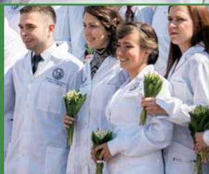
CEREMONIA BIAŁEGO FARTUCHA 2014 STR. 25