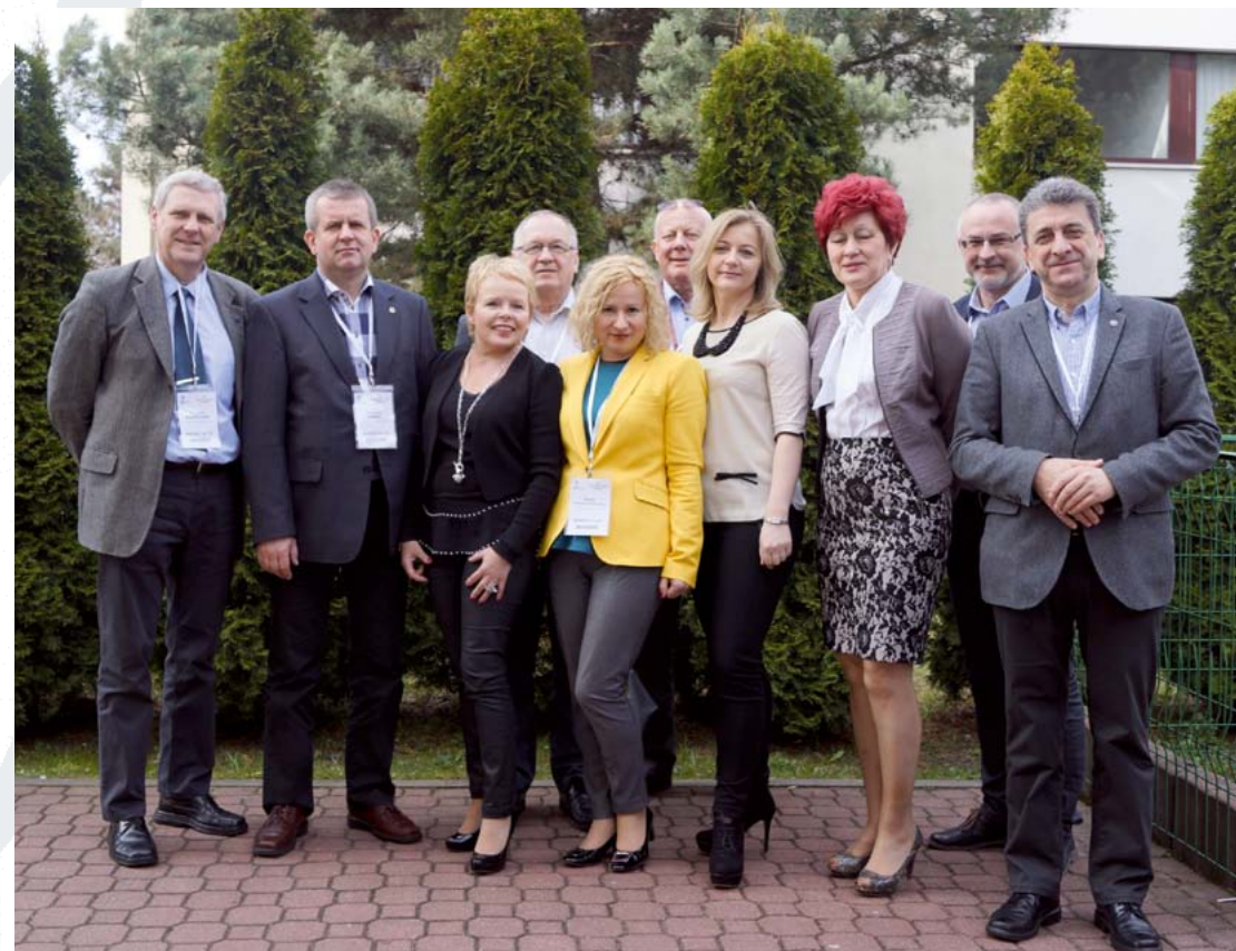
Delegaci Warmińsko-Mazurskiej Izby Lekarskiej