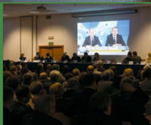
XII KRAJOWY ZJAZD LEKARZY STR. 23