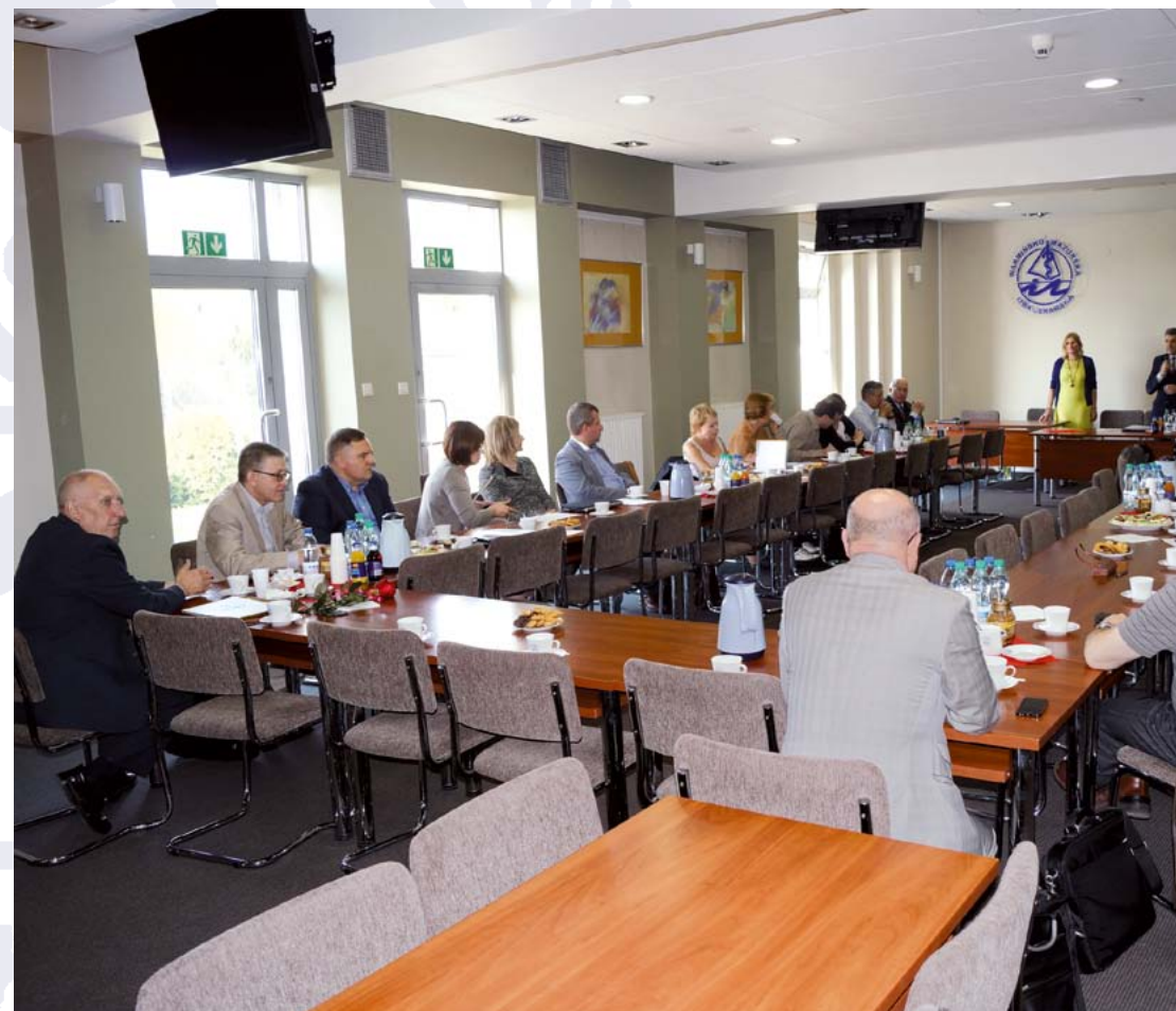
Posiedzenie Okręgowej Rady Lekarskiej 13 maja 2014