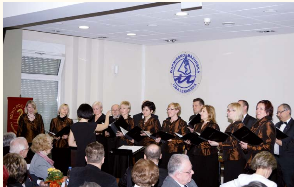
Występ chóru Medici pro Musica

tytuł nadany przez Prezydenta Rzeczypospolitej Polskiej 7 stycznia 2014 r.