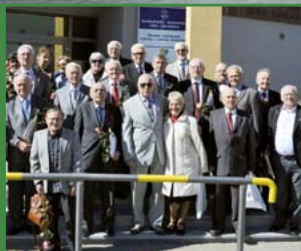
OKRĘGOWY ZJAZD LEKARZY str. 6