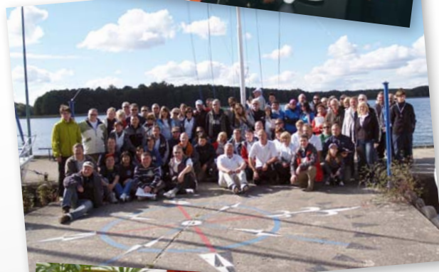
05.09.2010. Uczestnicy Mistrzostw Pol- ski w Żeglar- stwie