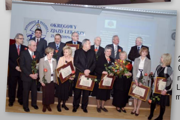
2009. Odznaczeni Zasłużony Lekarz Warmii i Mazur