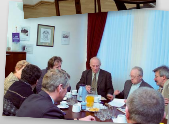
18.01.2006. Zebranie Kapituły Orderu ZLWM