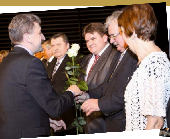
Słowa uznania nagrodzonym