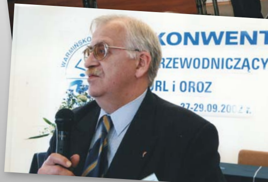
27.09.2002. Konwent Przewodniczących ORL Olsztyn