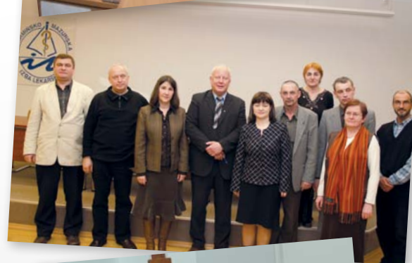
08.03.2006. Sygnatariusze Porozumienia Krajowego Komitetu Porozumiewawczego na rzecz Wzrostu Wynagrodzeń Pracowników Służby Zdrowia