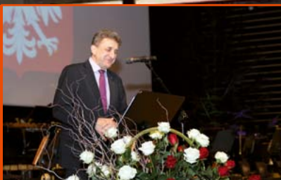
25 LAT WARMIŃSKO-MAZURSKIEJ IZBY LEKARSKIEJ W OLSZTYNIE