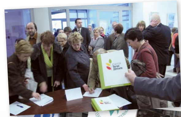
30.03.2006. Koalicja Teraz Zdrowie