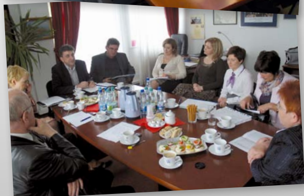
2010. Posiedzenie prezydium ORL