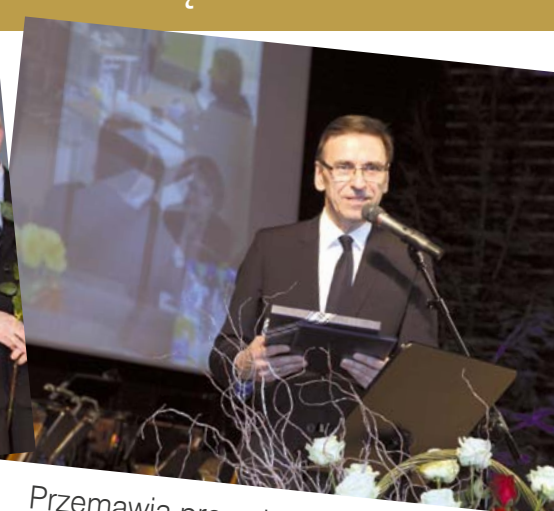
Przemawia prezydent Olsztyna Piotr Grzymowicz

Delegat na Krajowy Zjazd Lekarzy – kadencja VI i VII Z-ca Przewodniczącego Okręgowego Sądu Lekarskiego – kadencja VII