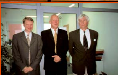
PREZESI OKRĘGOWEJ IZBY LEKARSKIEJ