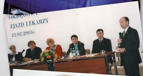
22.02.2002. Dr Konstanty Radziwiłł