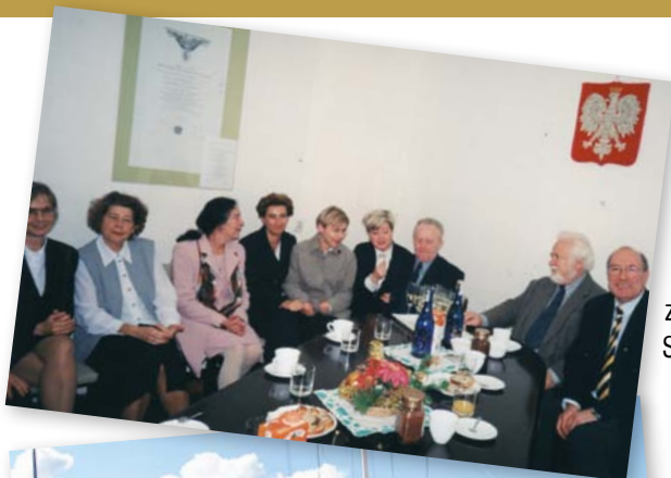
31.12.2009. Uroczyste posiedzenie pre- zydium ORL. Sanepid Olsztyn