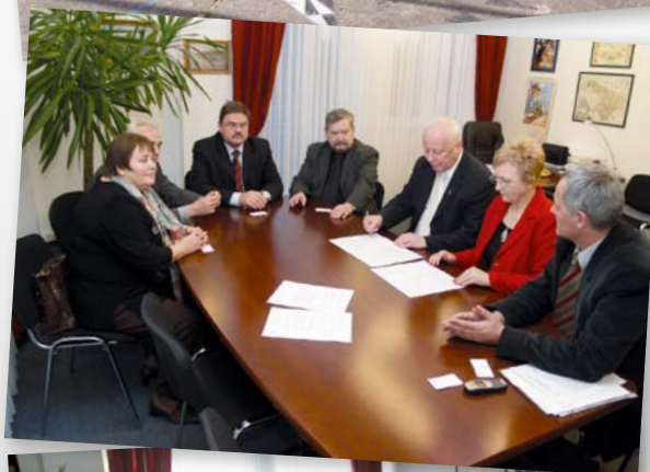
20.12.2010. Podpisanie porozumie- nia z lekarzami obwodu kali- ningradzkiego