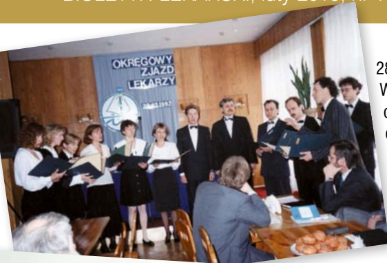
28.03.1992. Wystąpienie chóru Medyci pro Musica podczas Okręgowego Zjazdu Lekarzy