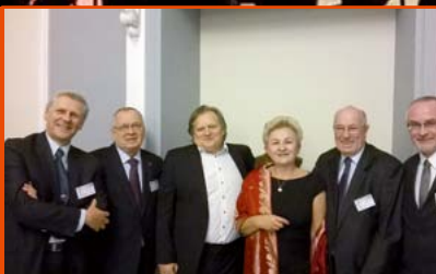
OBCHODY 25-LECIA ODRODZENIA IZB LEKARSKICH W WARSZAWIE