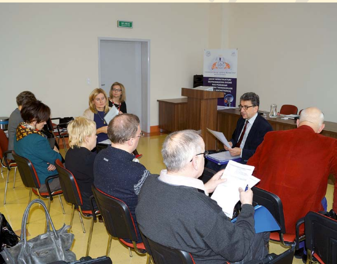
Wyjazdowe posiedzenie Prezydium w Szpitalu Uniwersyteckim 12 października 2014 r.