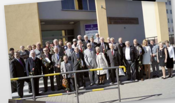
10.08.2014. Odznaczenie za długoletnią pracę w zawo- dzie