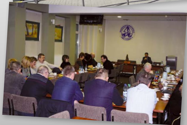
15.01.2014. Posiedzenie Okręgowej Rady Lekarskiej