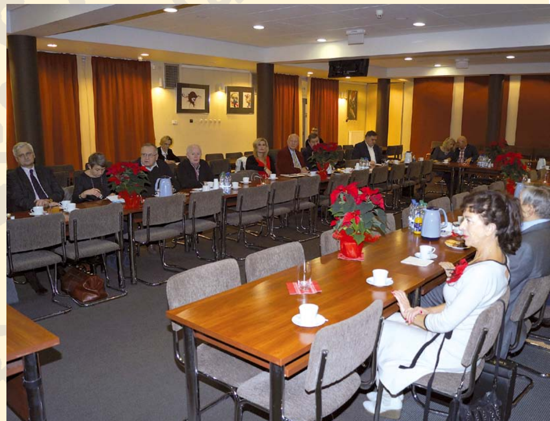
Posiedzenie Okręgowej Rady Lekarskiej 17 grudnia 2014 r.