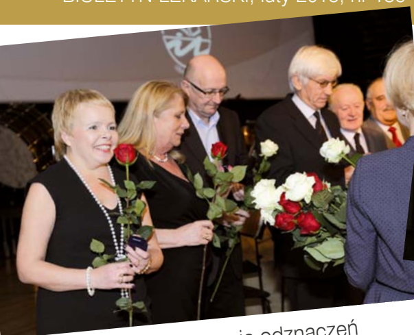
Ceremonia wręczenia odznaczeń za zasługi dla samorządu

Członek Okręgowej Rady Lekarskiej – kadencja VI, VII Członek Prezydium Okręgowej Rady Lekarskiej – kadencja VI, VII Przewodnicząca Komisji Etyki ORL – kadencja VI, VII