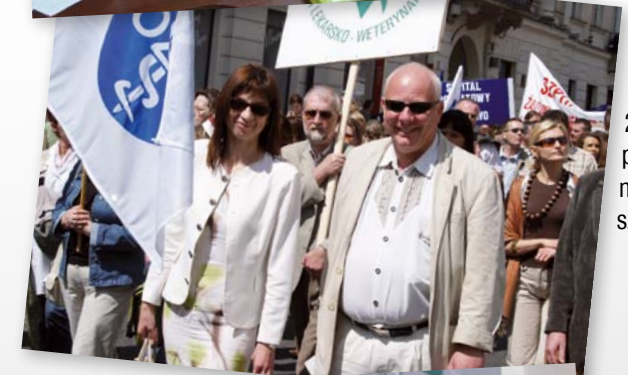
2006. Akcja protestacyjna w Warszawie