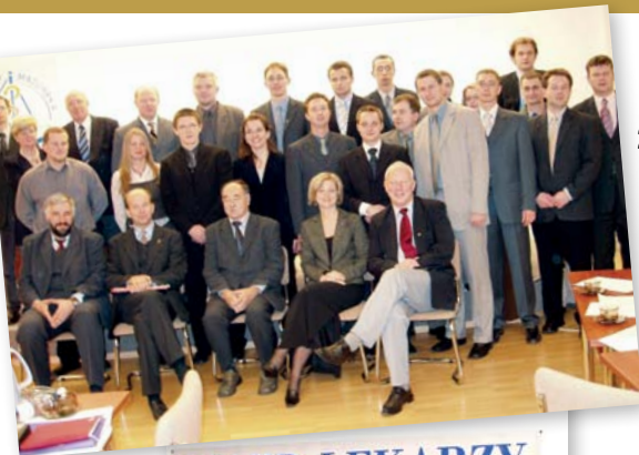
29.11.2003. Olsztyn. Konferencja Młodych Lekarzy