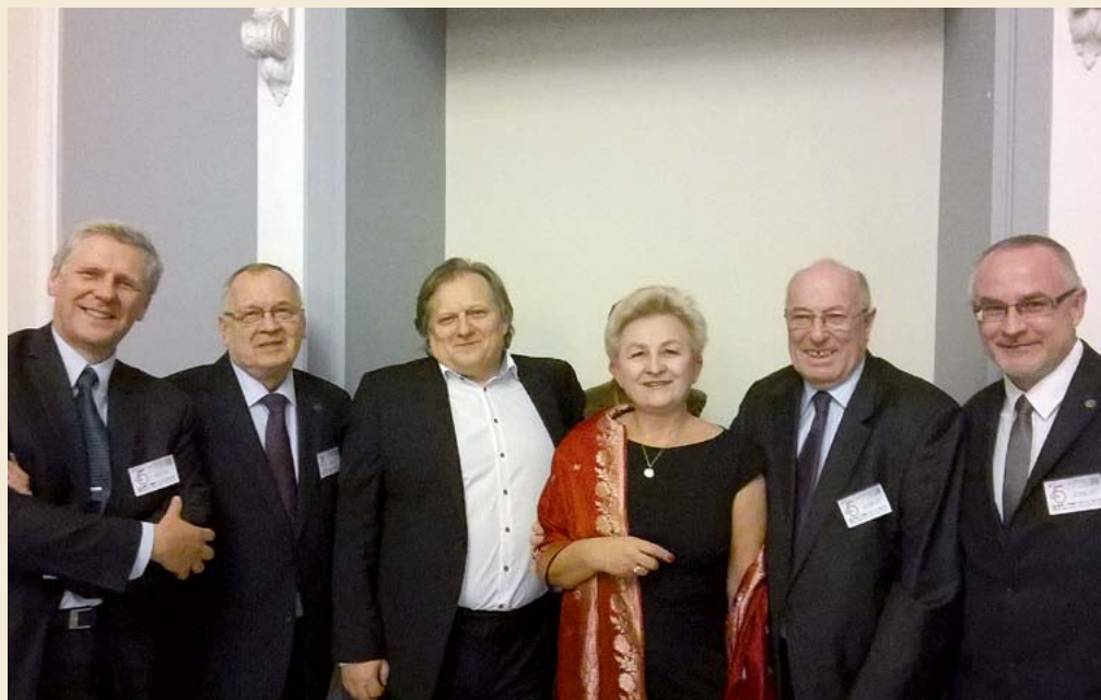
Delegaci Warmińsko-Mazurskiej Izby Lekarskiej na gali w Teatrze Narodowym