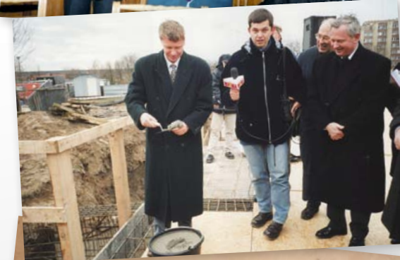
15.03.2000. Wmurowanie kamienia węgielnego pod budowę Domu Lekarsza