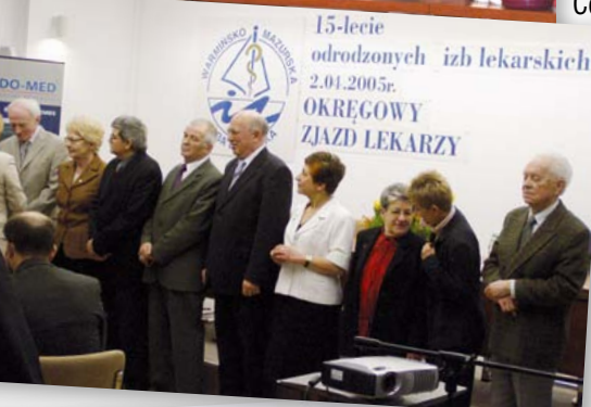
02.04.2005. Ceremonia odznaczenia lekarzy za pracę na rzecz samorządu z okazji 15-lecia odrodzenia izb lekarskich