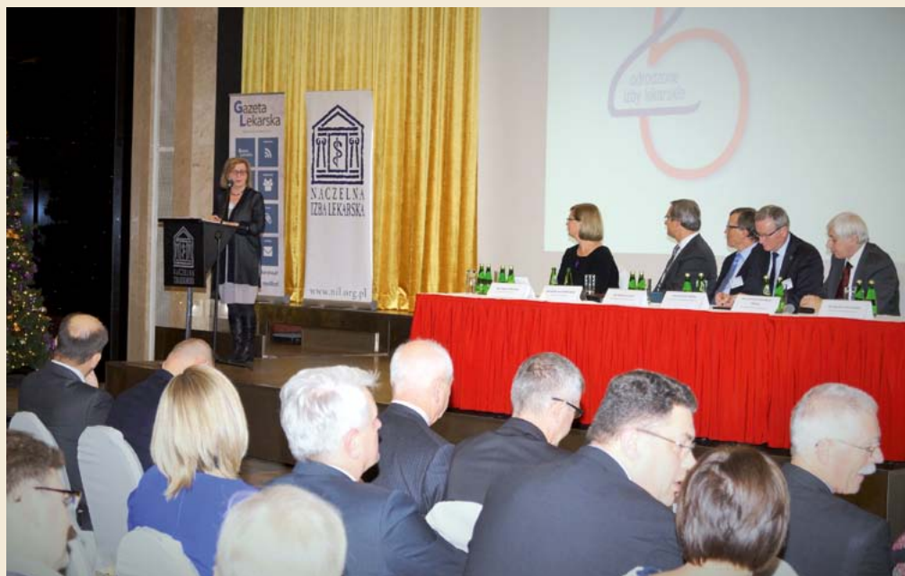
Uroczysta sesja naukowa