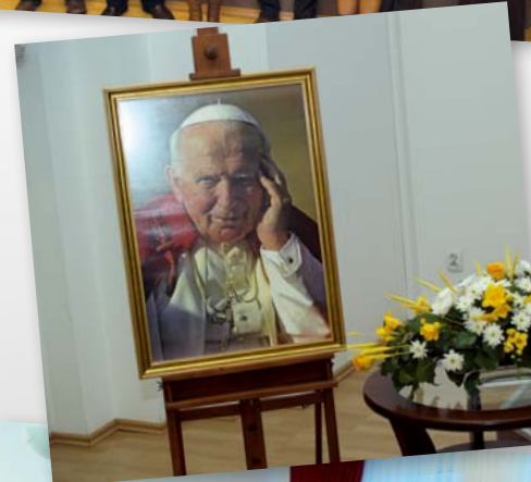
06.05.2006. Konferencja „Kres ludzkiego życia w nauczaniu Jana Pawła II”